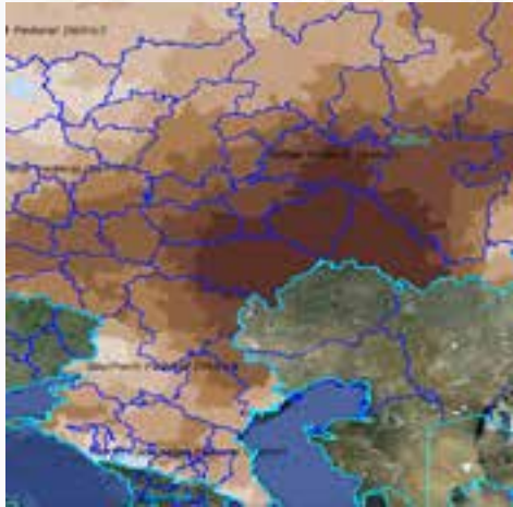
Европейская часть РФ 2010 г.