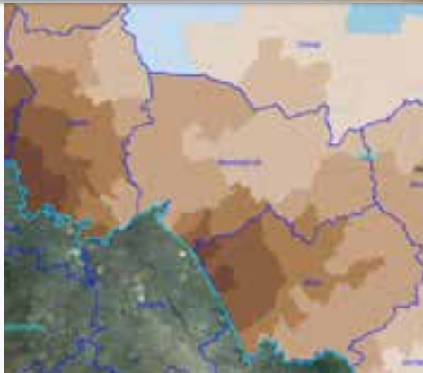
Сибирь 2010 г.