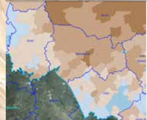
Сибирь 2012 г.