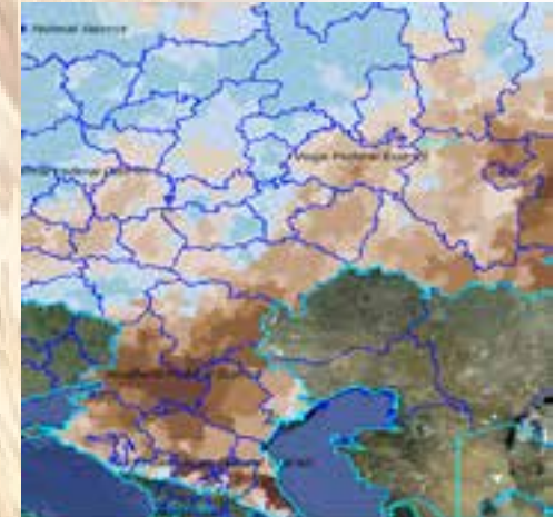
ЮГ РФ 2012 г.