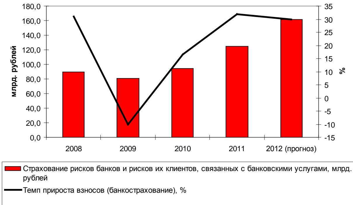
Динамика рынка банкострахования